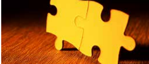
Naar een fusie voor Tremelo-Baal? p.2