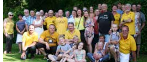
Uw mening doet er toe voor ons! p.3