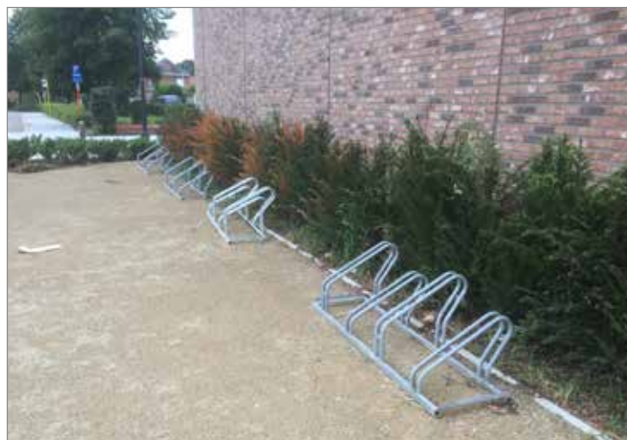
▲ Op de Vinneweg plaatste de gemeente tot onze verbazing vier losse fietsenrekjes. De N-VA blijft pleiten voor degelijke, beveiligde fietsenstallingen.

Spijtig genoeg keurde de meerderheid ons voorstel niet goed. Tot onze verbazing kwamen er na onze vraag wel vier losse fietsenrekjes op de Vinneweg, maar dat is niet wat onze inwoners verwachten.