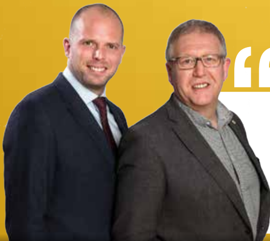
Theo Francken Staatssecretaris Lijstduwer