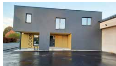
Het terrein van de loods wordt uitgebreid voor opslag van materialen

"Omdat we echt nood hebben aan een buitenterrein voor opslag, hebben we aan de aanpalende eigenaars van de loods gevraagd of ze (een deel van) hun gronden willen verkopen." Twee grondeigenaars gingen in op onze vraag. Daardoor kon de gemeente twee terreinen van respectievelijk 28,7 en 1,64 are aankopen. De opslag zal milieutechnisch aangepast worden.