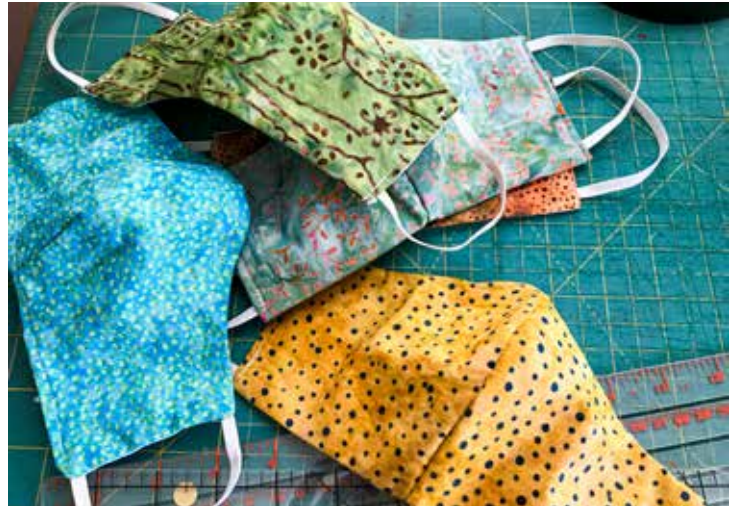
▲ De gemeente zorgt voor 15.000 herbruikbare mondkmaskers en instructies om ze veilig te gebruiken.

Artsen, kinesisten, thuisverpleegkundigen, vroedvrouwen, tandartsen en begrafenisondernemers hebben we via de provincie de nodige chirurgische maskers bezorgd, zodat zij veilig kunnen werken.